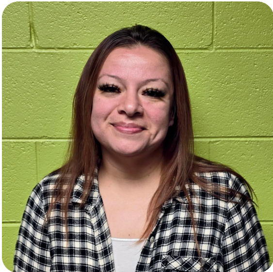
Bam Marzo 2026 A la Izquierda